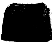
Linge de toilette