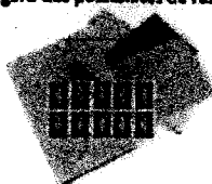
Nécessaire de courrier

Emballer les aliments dans des boîtes en plastique transparent ou des sachets plastiques (type sachets de congélation) fermés avec des élastiques ou des liens sans métal